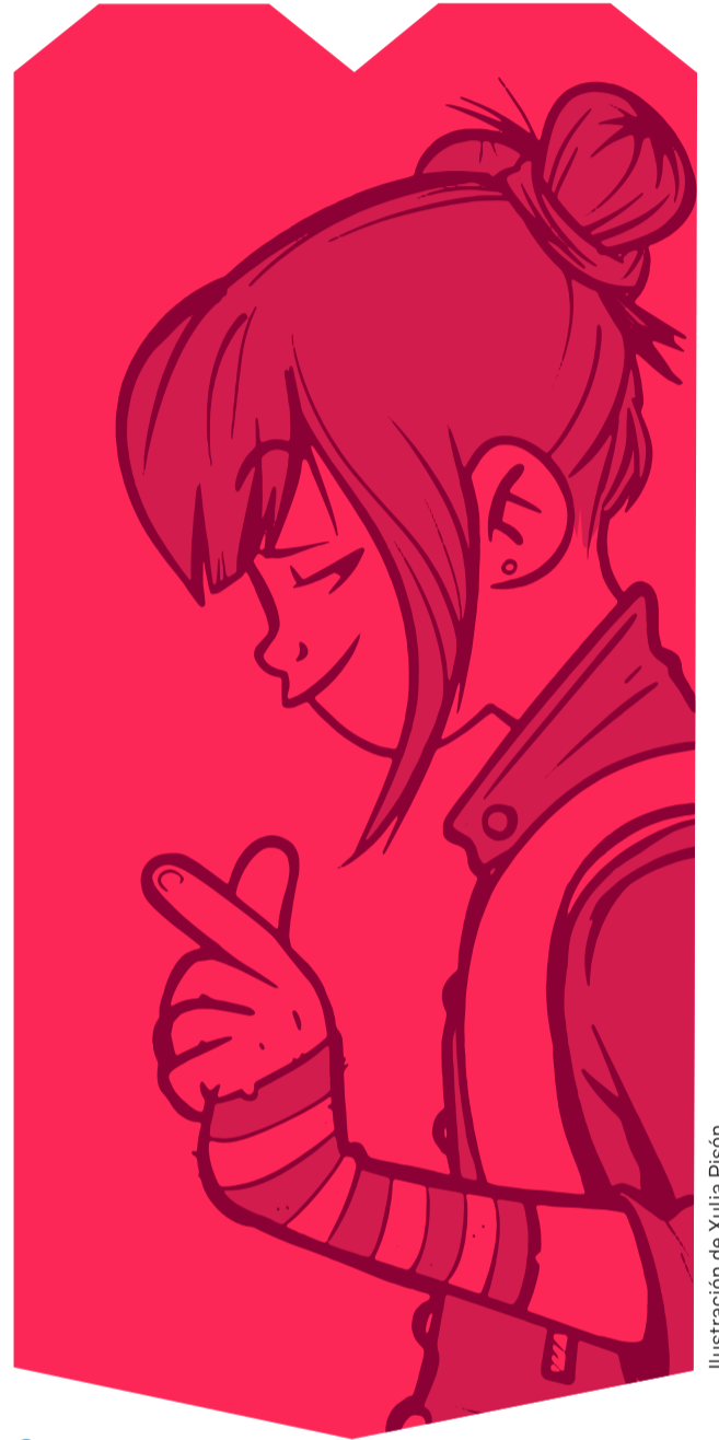
Ilustración de Xulia Piñón